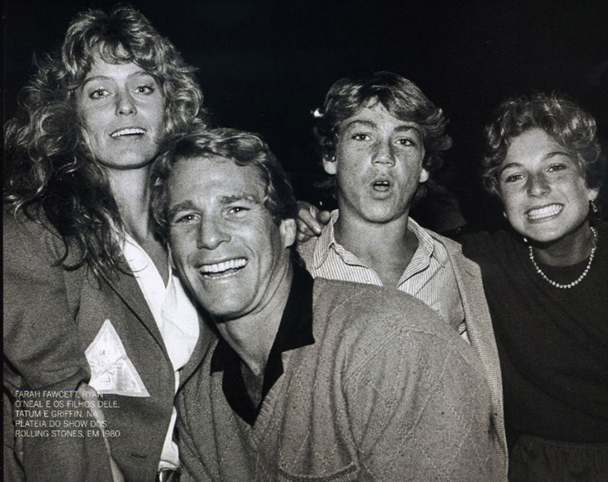
FARAH FAWCETT, RYAN O'NEAL E OS FILHOS DELE, TATUM E GRIFFIN, NA PLATEIA DO SHOW DOS ROLLING STONES, EM 1980