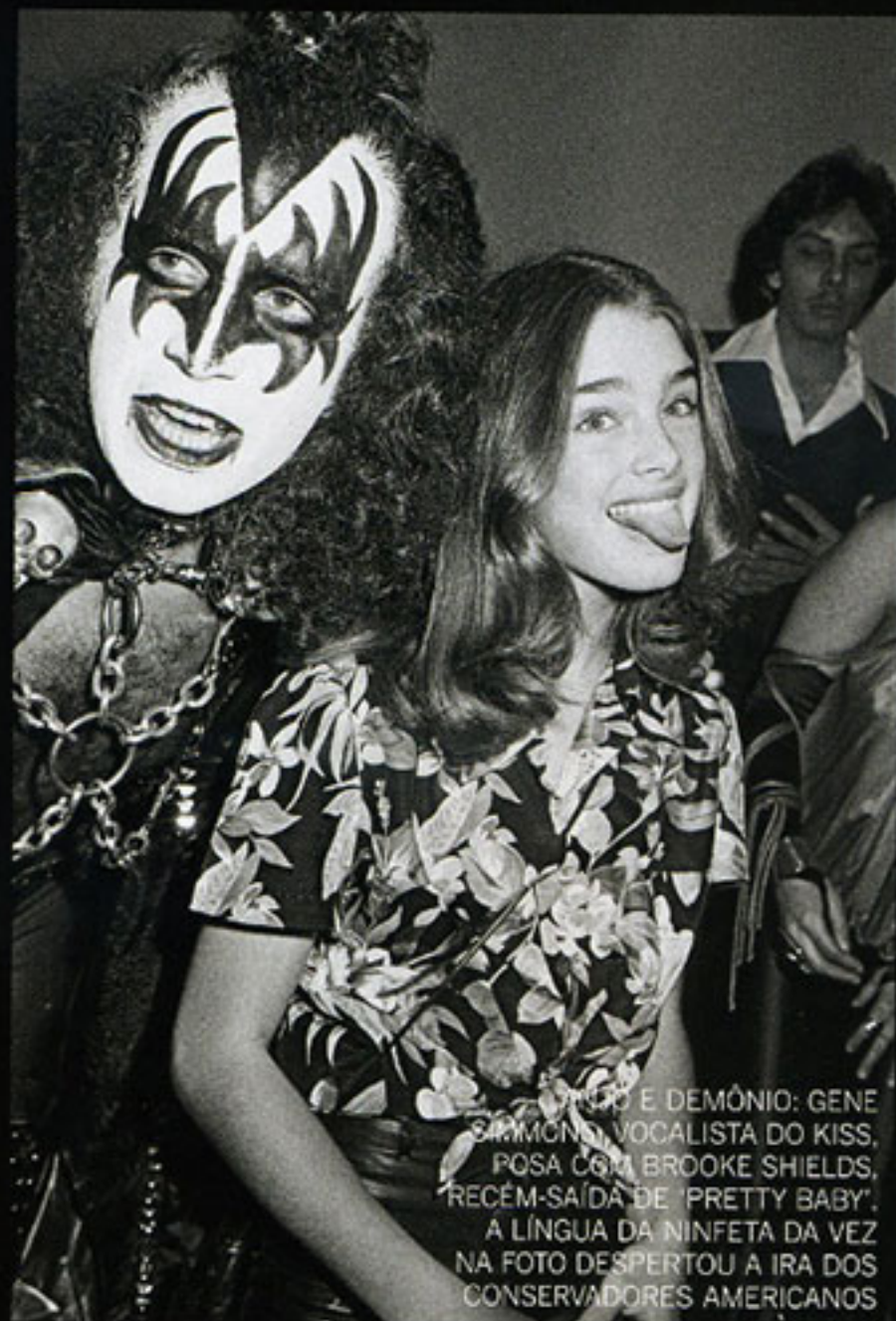
ANJO E DEMÔNIO: GENE SIMMONS, VOCALISTA DO KISS, POUSA COM BROOKE SHIELDS, RECÉM-SAÍDA DE 'PRETTY BABY'. A LÍNGUA DA NINFETA DA VEZ NA FOTO DESPERTOU A IRA DOS CONSERVADORES AMERICANOS

"Não me impressionava com garotas nuas, pois ia a três ou quatro festas cheias delas toda semana. Capturei uma era que jamais se repetirá", diz o paparazzo